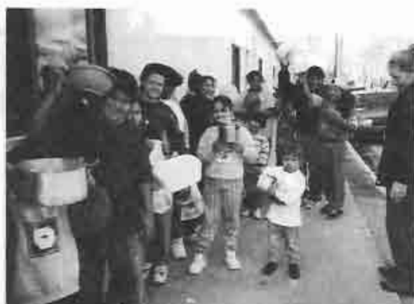
Repartiendo el almuerzo

Al estudiar el terreno en el cual vamos a desarrollarnos debemos preguntarnos en primer lugar sobre la ubicación geográfica, la demografía, características étnicas, históricas, culturales, y cada herramienta que pueda significarnos la eliminación de obstáculos para la presentación del Evangelio. Esto no quiere decir que tendremos una empresa fácil y con el éxito asegurado, pero al menos podremos evitar aquellas cosas que sí pueden ser evitadas con un estudio de campo.