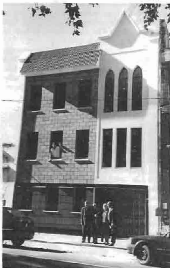
Iglesia La Misión

La ciudad de Buenos Aires cuenta con una gran diversidad social, cultural y religiosa, proveniente de la herencia y el presente cosmopolita de las grandes urbes. Según datos del INDEC (Instituto Nacional de Estadísticas y Censos) para el año 2001 un poco más del 11% de la población estable de la ciudad estaba constituida por extranjeros. De estos más de la mitad pertenece a inmigrantes latinoamericanos de países