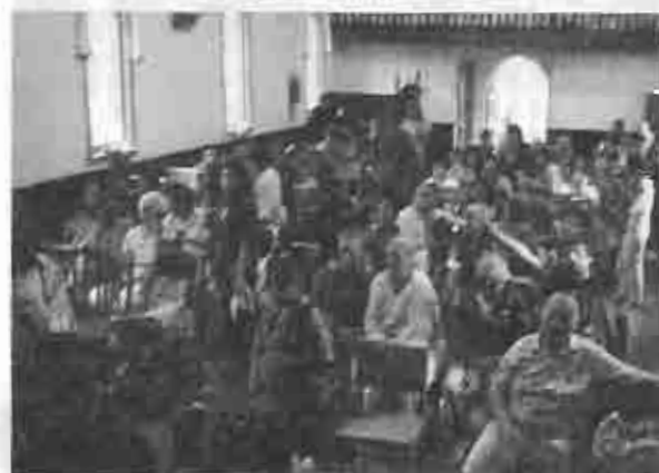
Reunidos en el Salón

En la última reunión del año, el miércoles 16 de diciembre, se preparó un ágape especial para todos.