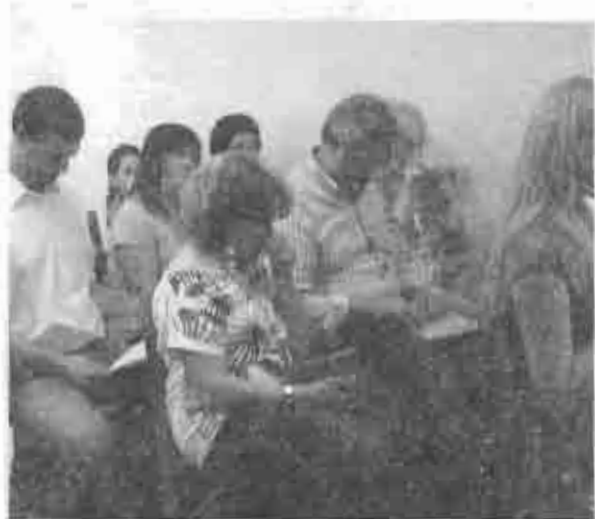
Cena navideña en la iglesia de Escalada.