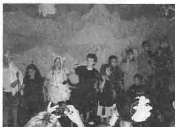
Representación de Escuela Bíblica Familiar en la fiesta de fin de año