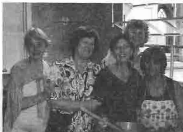
Las "chicas" preparando la merienda en la cocina.