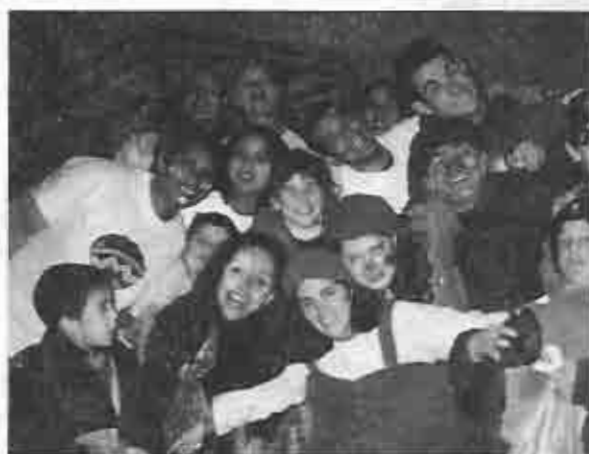
Fiesta Día del Niño

y la salvación individual. Han venido a ser un bálsamo para las comunidades donde se han plantado, y son quienes han estado cerca de sus necesidades.