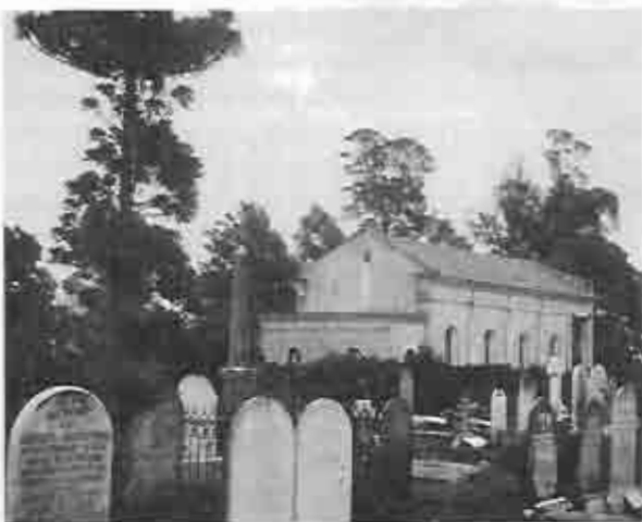
Cementerio e Iglesia 1957

Esta antigua Iglesia y el Cementerio fueron construidos por los vecinos escoceses en 1872, aunque el Cementerio se inauguró antes con víctimas de la fiebre amarilla que azotó la región en el verano de 1868/69. Aunque está tan cerca de la ciudad, está muy lejos en cuanto a su accesibilidad cuando llueve y la falta de luz eléctrica para su iluminación y para bombear agua. Dos problemas que son relativamente fáciles de solucionar, pero, siempre hay un pero, la iglesia tiene pocos miembros y tienen además que mantener la capilla en el centro de Chascomús, en Belgrano 57. Recientemente han ampliado la superficie disponible del cementerio al doble y está preparado para recibir más entierros, lo que ayudaría a sufragar los gastos inherentes al mantenimiento del cementerio pues la parte antigua tiene que ser mantenida también ya que los deudos de los fallecidos ciento cuarenta años atrás han desaparecido. El problema mayor es si tienen un servicio fúnebre después de una lluvia la llegada al Cementerio es imposible, tampoco se puede llegar un domingo para un culto por la misma razón.