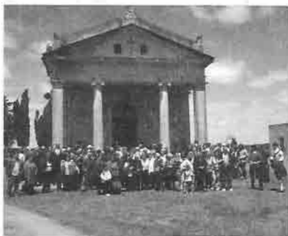
Los presentes al terminar el culto celebrando los 150 años de la Iglesia, noviembre de 2007

Solo faltan unos treientos metros que mejorar con piedra suelta, estimando que, con tres camionadas, se solucionaría el problema. Cada camión cuesta $2500 por lo tanto con $ 7.500 es el monto requerido.