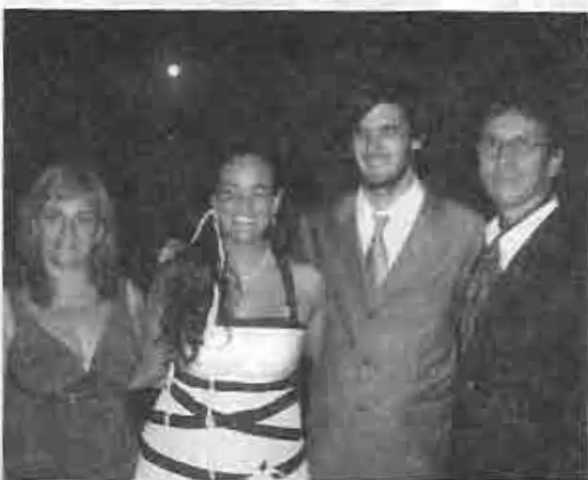
Los novios con los padres de la novia