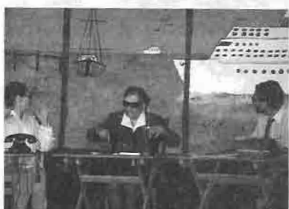
Actuación del grupo de teatro en la fiesta de fin de año